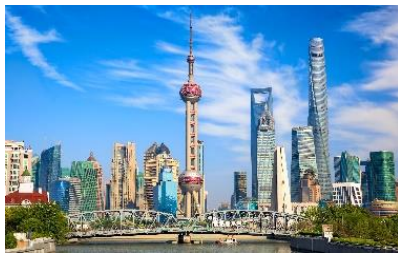
Shanghai: de Bund

Belangrijks plaatsen voor tekenen, schilderen en bezoeken