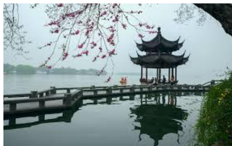
Hangzhou: west meer