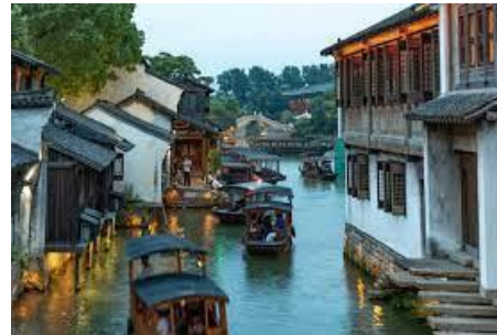
Schilderachtige waterdorpjes in Wuzhen