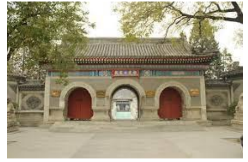
Wilde muur in ongerestaureerde staat. Ontmoeting met de monnike van taoïstische tempel "White Cloud Taoist Tempel"